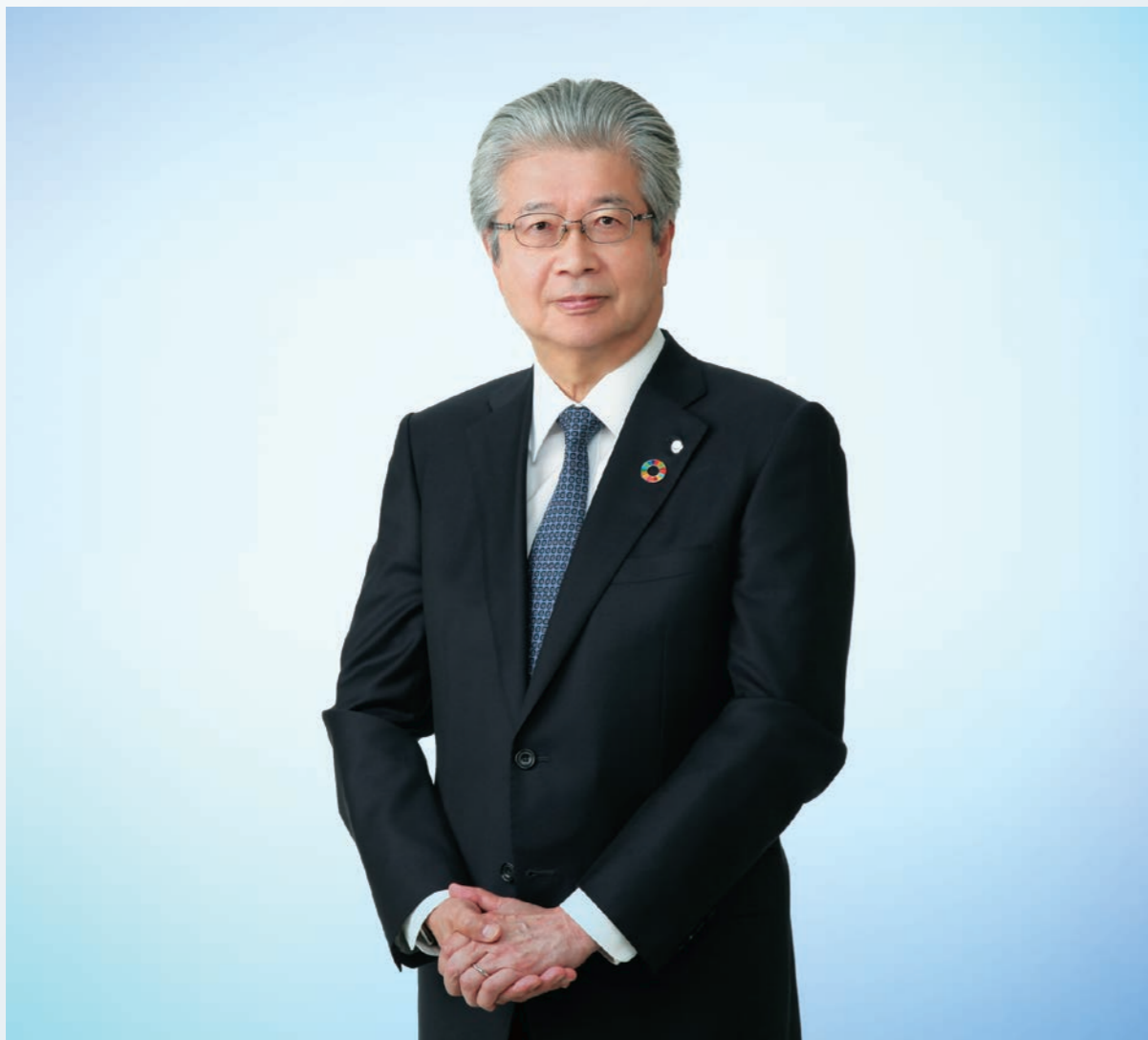
代表取締役会長 兼 CEO